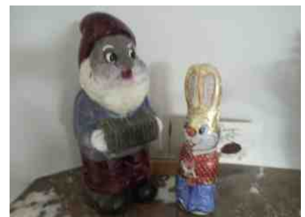
De hospita van Panneman

bijna dagelijks strijd tussen de freule van het huis (de kat) en de nieuwe huisgenoot, Panneman. De ene keer ligt Panneman in freeze stand op zijn rug, de andere keer is de kat in geen velden of wegen te bekennen: weggepest uit eigen huis? Ik heb het stel maar eens naast me op de bank gezet en een goed gesprek met hen gevoerd. Wat is er werkelijk aan de hand? Na een hele avond praten komt uiteindelijk de aap uit de mouw: Poeslief wil overdag slapen en Panneman volop uitgerust, wil overdag bezig zijn, muziek spelen en gezelschap. Zelf op jacht naar een baan gaan gebeurt ook maar mondjesmaat. Maar alleen met een beetje spelen red je het niet in het leven dus er moet toch wat gebeuren. Ondertussen is de Paashaas ook binnengekomen en ook daar moet Panneman niets van hebben. Wordt het dan toch geen tijd...??? De volgende morgen blijkt dat Panneman vertrokken is, zonder briefje, adres of wat dan ook.... Is dat dan de ware aard van de kabouterman?