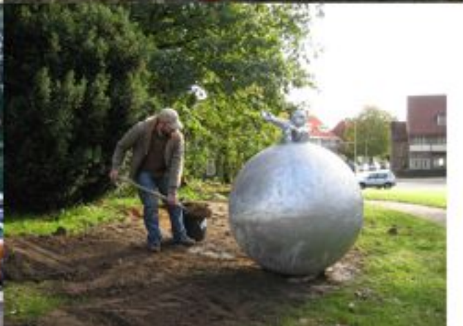
De bol onderaan Oude Kluizeweg

Het zal u misschien ontgaan zijn, maar afgelopen 20 oktober zijn zes van de negen kunstwerken van de Alteveer 't Cranevelt kunstroute geplaatst. Eén stond er al, het lezend kindje boven het Beethovenplein. Er volgen nog een Pizzatafel op het