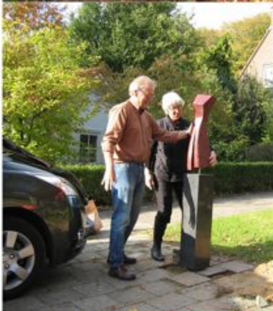
Jurk bovenaan de Sweelincklaan