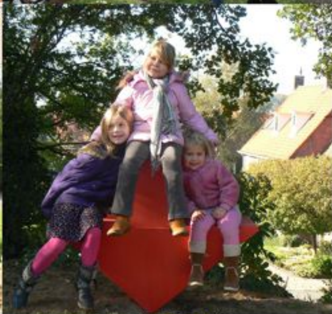
Pijl langs de Diepenbroocklaan