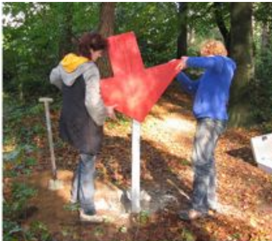
Pijl onderaan de Amorijstraat