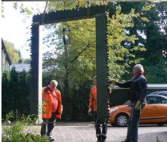
Poort aan de E. v. Beinumlaan