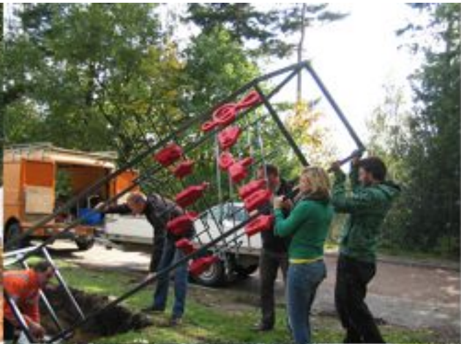
Muziekhuisje aan de Lisztstraat