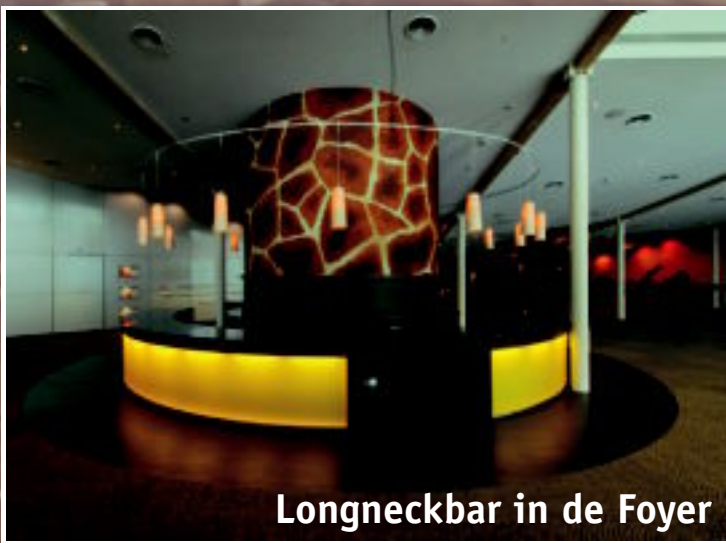
Longneckbar in de Foyer

Op een prachtige locatie midden in Burgers' Zoo vindt u het Safari Meeting Centre. Dit moderne congrescentrum, dat grenst aan Burgers' Safari, is geheel in Afrikaanse stijl opgetrokken. Nadat de gasten via het tropische Burgers' Bush in het Safari Meeting Centre arriveren, wacht hen daar een sfeervolle, inspirerende omgeving.