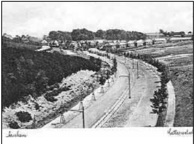
Cattepoelseweg-Heselbergseweg (voor de oorlog)

De meest brutalen onder ons - tja, sorry, ik behoorde daar ook toe - klommen over de omheining en zochten de meest smakelijke knolletjes uit... Want, de kleintjes moest je hebben! Die waren het