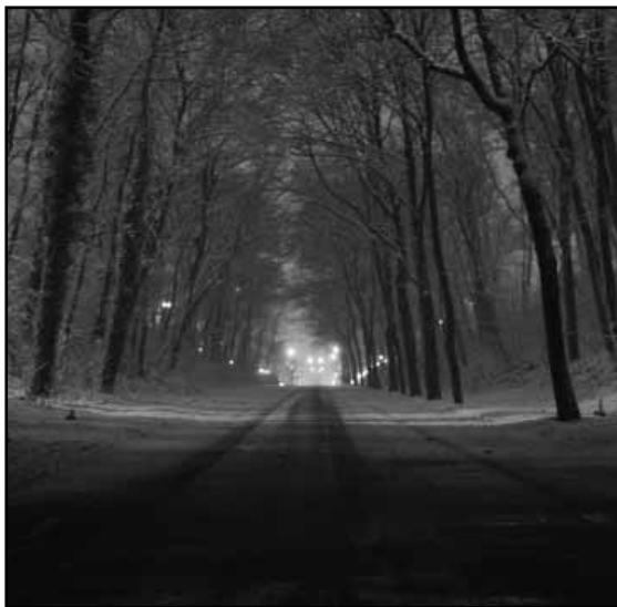
Cattepoelseweg ter hoogte van het transferium op een winterse evenementloze avond