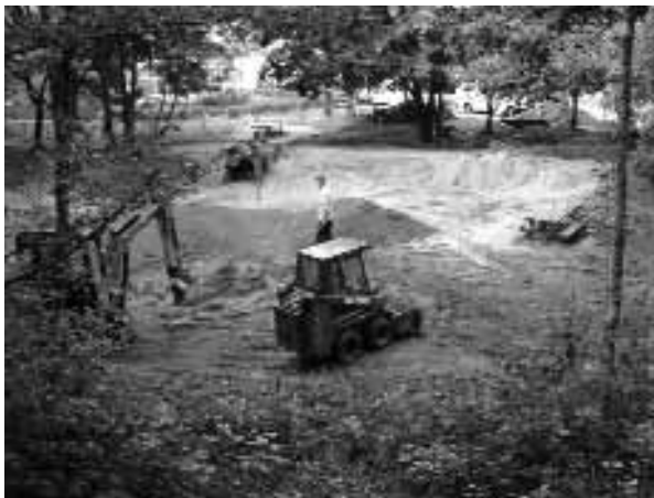
De speeltuin in aanleg

De speeltuin aan de Bernard Zweerslaan is klaar! De firma Donkers heeft vlak na de bouwvak de speeltuin opnieuw ingericht. Het inrichtingsconcept is 'natuurlijk spelen'. Dit betekent dat kinderen worden uitgedaagd om met behulp van de natuurlijke omgeving hun spel vorm te geven.