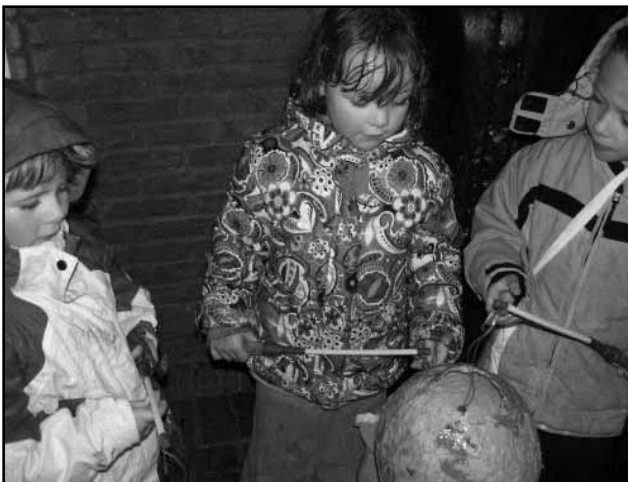
Sint Maarten 2007 in de wijk

Als deze Craneveer verschijnt, is het al bijna 2008. Op zondag 11 november zijn ondanks het koude en later natte weer diverse kinderen langs de deuren gegaan met hun lampion en liedje. De sint is in de wijk weer volop actief geweest en de mensen zijn druk in de weer met kerstgroen en lampjes.