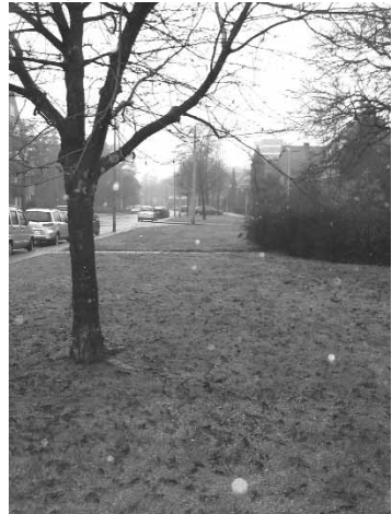
Toekomstig jeu-de boules baan?

Als er nog meer mensen zijn die graag mee willen denken over mogelijkheden hoe met elkaar gebruik te maken van deze jeu de boulesbaan, dan kunnen zij zich aanmelden bij mij.