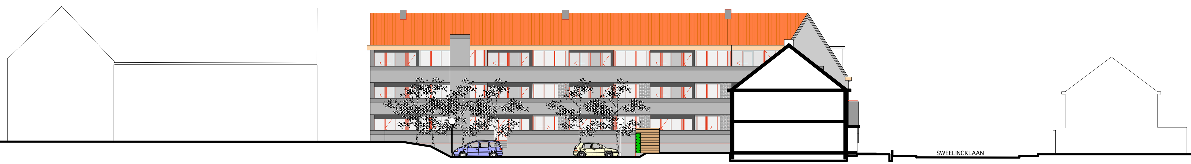
GEVELS APPARTEMENTEN BINNENTERREN (PROFIEL AA)